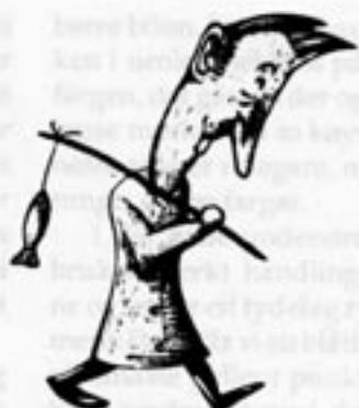
Ein av Fam Ekman's illustrasjonar i Sorg er en pike

Harry kjedar seg og må finna på noko. Han legg ut på ein ekspedisjon for å finna ting å byggja med. Kva han skal byggja? Det skal byggverket sjølv få bestemma – "jeg bare begynner nederst i den ene enden". Han finn mange ting som han puttar i sykkelveska si, både deler av vekkjarklokker og ei bok med kakeoppskrifter, men også "en sval vind fra vest, massevis av godt humør, lyden av et tog langt borte", og mykje meir. Medan han leita etter en god begynnelse møter han den heldige hunden Rudolph.